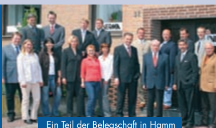
Ein Teil der Belegschaft in Hamm

Oberster Grundsatz unserer Firmenphilosophie ist die Zufriedenheit unserer Kunden.